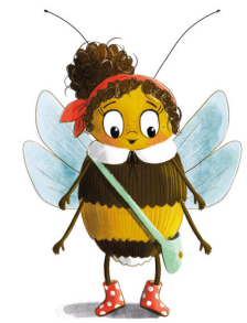
Illustration: Saskia Diederichsen