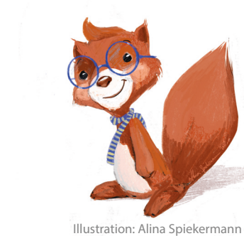
Illustration: Alina Spiekermann